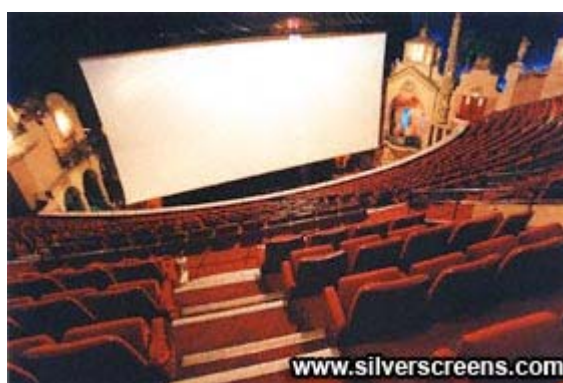
Slika 3 – Vizure projekcionog ekrana sa druge galerije bioskopa "Le Grand Rex"

Pre svega, ova sala ima dve galerije, pri čemu je druga galerija sa 1300 mesta tako da je skoro polovina publike na njoj. Vizure sa druge galerije po našem mišljenju su daleko lošije nego sa galerije Velike dvorane SC-a, što se vidi i na sl. 3.