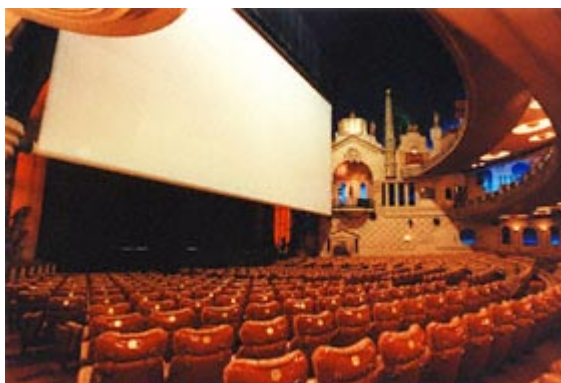
Slika 4 – Vizure projekcionog ekrana iz zadnjih redova partera bioskopa "Le Grand Rex"

se može videti na sl. 4. Iz navedenih razloga parter i prva galerija se danas praktično i ne koriste za filmske projekcije.