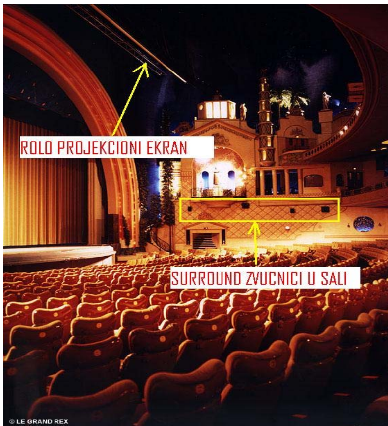
Slika 5 – Dispozicija "surround" zvučnika u parteru bioskopa "Le Grand Rex"

Što se tiče postavke surround zvučnika u bioskopu "Le Grand Rex" je ostvarena klasična postavka sa jednim nizom od 4 zvučnika po jednoj strani partera, koji su u odnosu na gledalište izdignuti na visinu od cca 5m. Takođe, očigledno je da nisu ugrađeni surround zvučnici ispod galerije pošto se ovaj prostor zbog loših vizura verovatno i ne koristi za gledaoce (sl. 5).