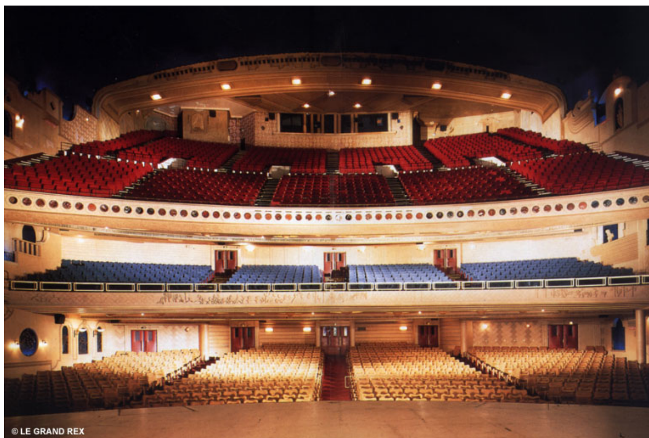
Slika 2 – Pogled na auditorijum bioskopa "Le Grand Rex"

Ova sala je u početku imala 5000 mesta, ali je posle više renoviranja osamdesetih godina prošlog veka dobila svoj finalni raskošni enterijerski izgled i sada ima 2750 mesta (sl. 2).