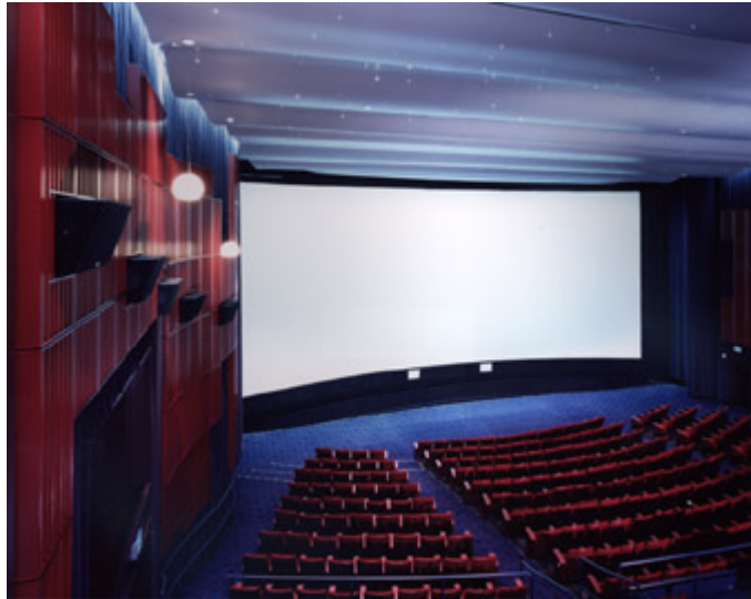
Slika 6 – Postavka "surround" zvučnika u bioskopu "Cinerama Theatre" – Seattle (visina ugradnje "surround" zvučnika je cca 5m)

Navedena postavka je daleko nepovoljnija u odnosu na Veliku dvoranu SC-a, gde su sa dva niza surround zvučnika uz primenu odgovarajućih linija za kašnjenje ostvareni uslovi da zvuk iz surround kanala dolazi do gledalaca sa usaglašenim nivoom kako u sredini auditorijuma tako i do onih koji su bliži bočnim zidovima sale. Ovaj koncept je za sada jedinstven u svetskim razmerama, s tim da je slično rešenje sa višekanalnim linijama za kašnjenje surround kanala 1999. godine ostvaren u bioskopu "Cinerama Theatre" u Sietlu - USA (sl. 6).